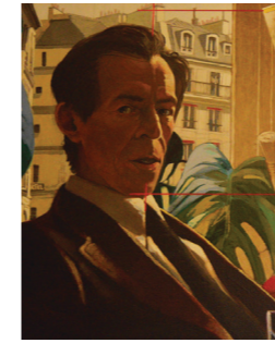
Retrato de J. R. Ribeyro por Herman Braun-Vega